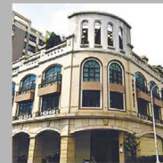
NO.5-7 風尚香樹大道 I - III