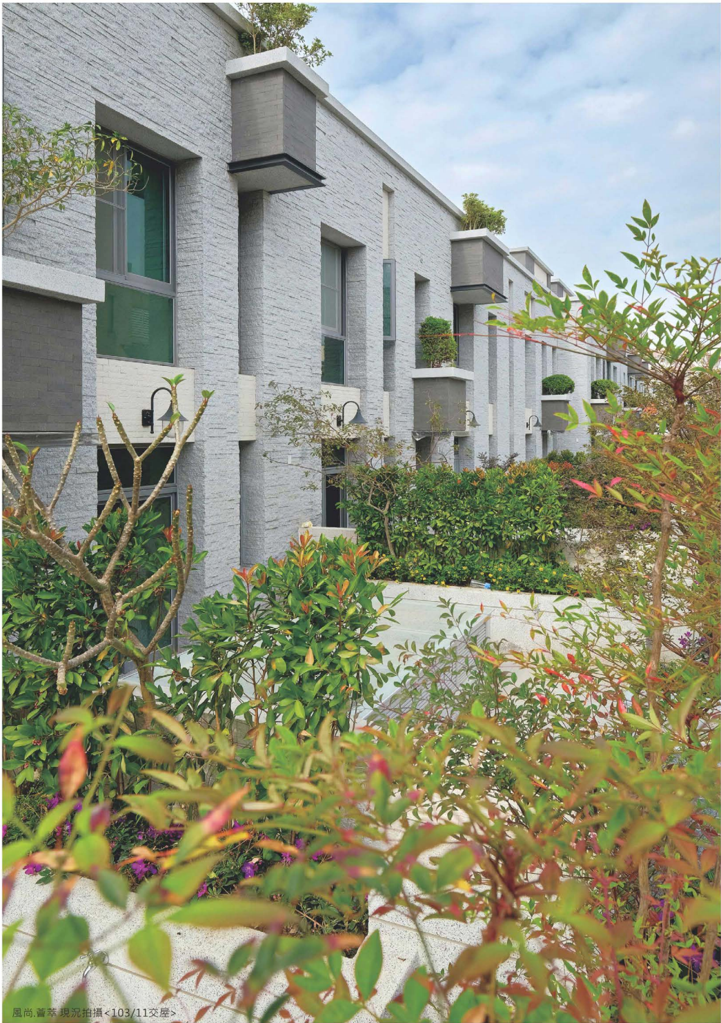
風尚 薈萃 現況拍攝 <103/11交屋>