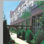
NO.3 維多利亞莊園 II