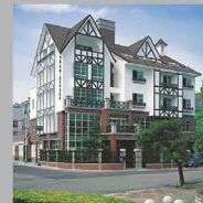
NO.2 維多利亞莊園 I